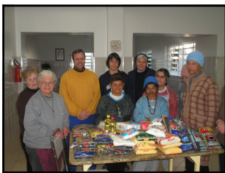
Doação de Alimentos no ASILO.

Novamente uma boa ação de todos que participam dos torneios promovido pelo Clube. Durante mês de Maio