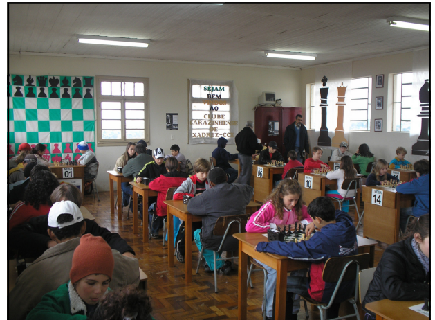
70 Enxadristas lotaram as dependências do Clube.

Salle é um torneio que começou para ser Local e teve